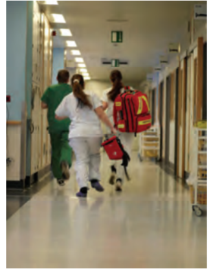
Travail en équipe