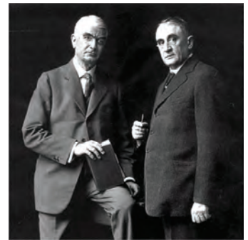
No one is big enough to be independent of the others (William Mayo, 1889)

namelijk datgene dat wij voor onze naasten (ouders en vrienden) en voor onszelf eisen wanneer zich door